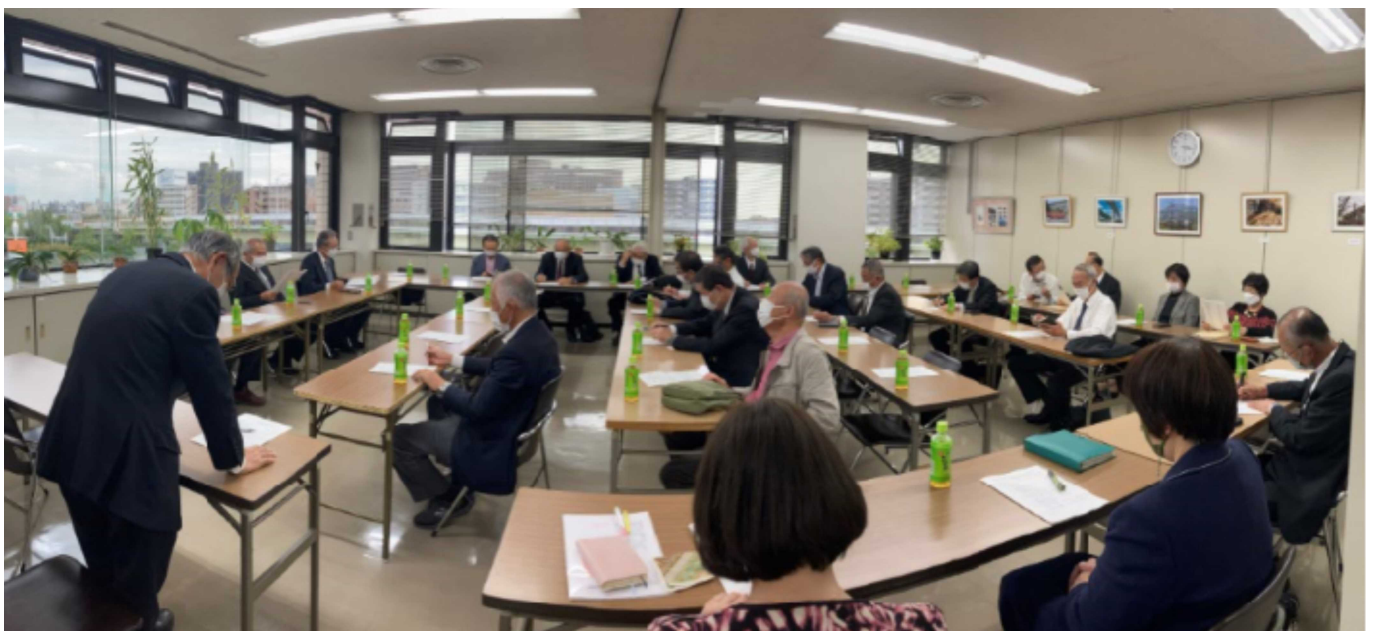
熱心に討議する参加者